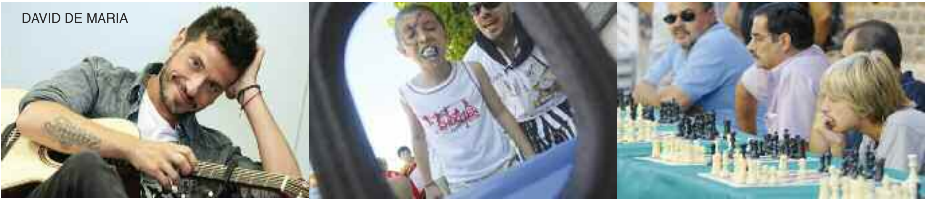
DAVID DE MARIA

18:00 h. PEÑA PUERTA ALCALA. Triatlón (Carpa de la Peña en Recinto Ferial)