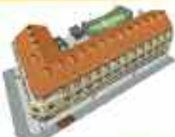
34 Viviendas de 1, 2 y 3 dormitorios incluye plaza de garaje y trastero