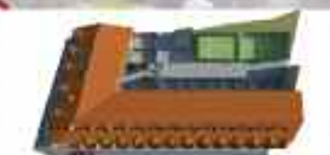
La mayoría de las viviendas cuentan con espacios abiertos tipo terraza y patio inglés. Urbanización con pista de pádel